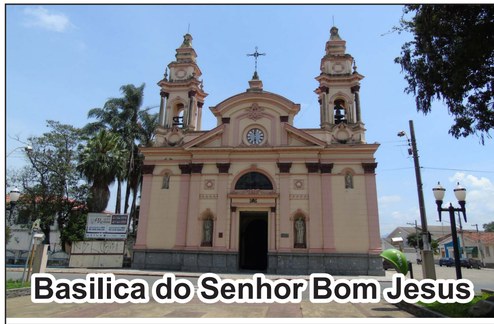
Basilica do Senhor Bom Jesus