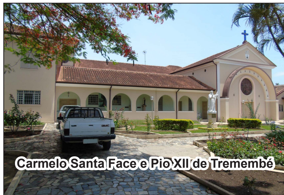
Carmelo Santa Face e Pio XII de Tremembé