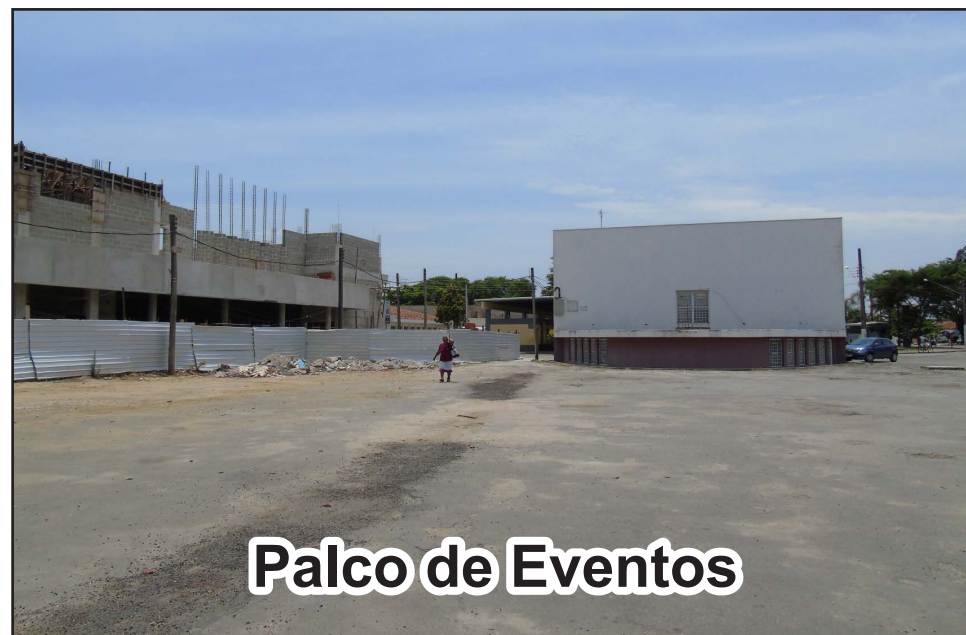
Palco de Eventos