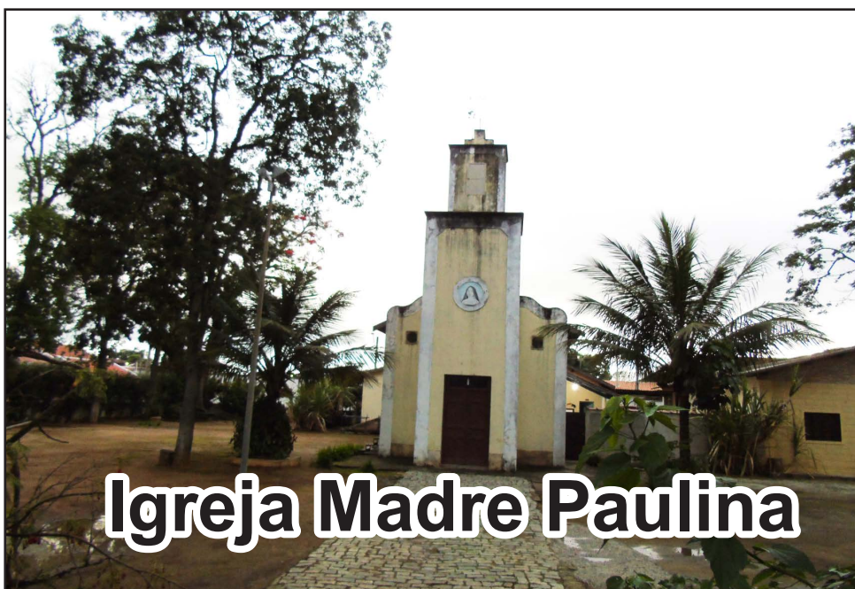
Igreja Madre Paulina