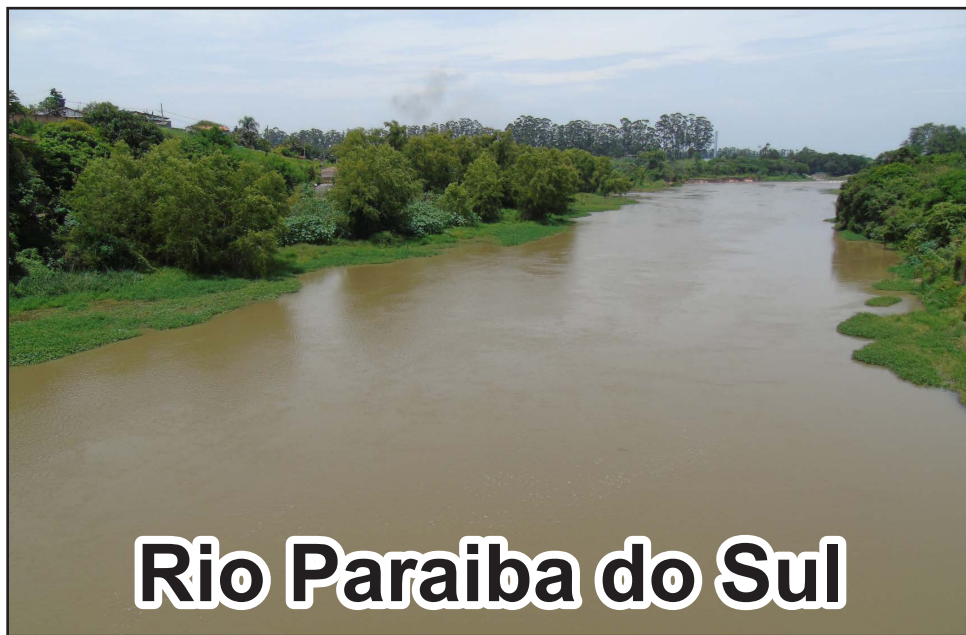
Rio Paraíba do Sul